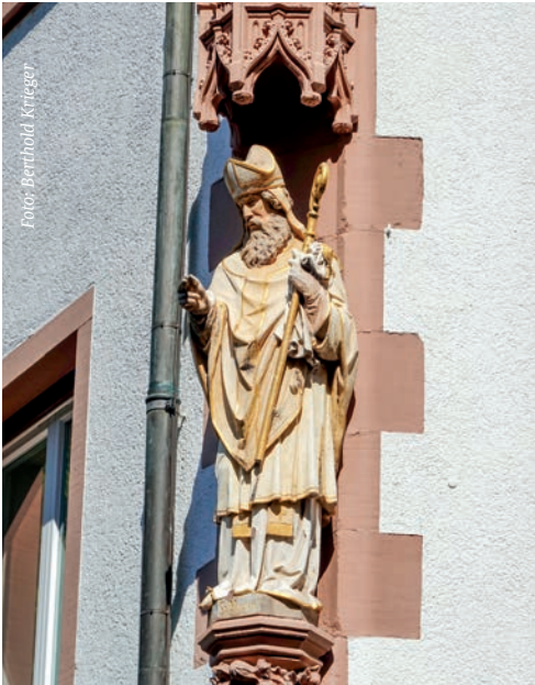
Der Heilige Martin mit segensreichem Blick auf den Freiburger Rathausplatz.

Sulzbürger Str. 18 79114 Freiburg 0761 4 90 78-0 pfarrbuero.st.andreas@ kath-freiburg-suedwest.de Mo, Fr: 15.00 – 17.30 Uhr Di, Do: 9.00 – 12.00 Uhr (in den Schulferienzeiten eventuell abweichend)