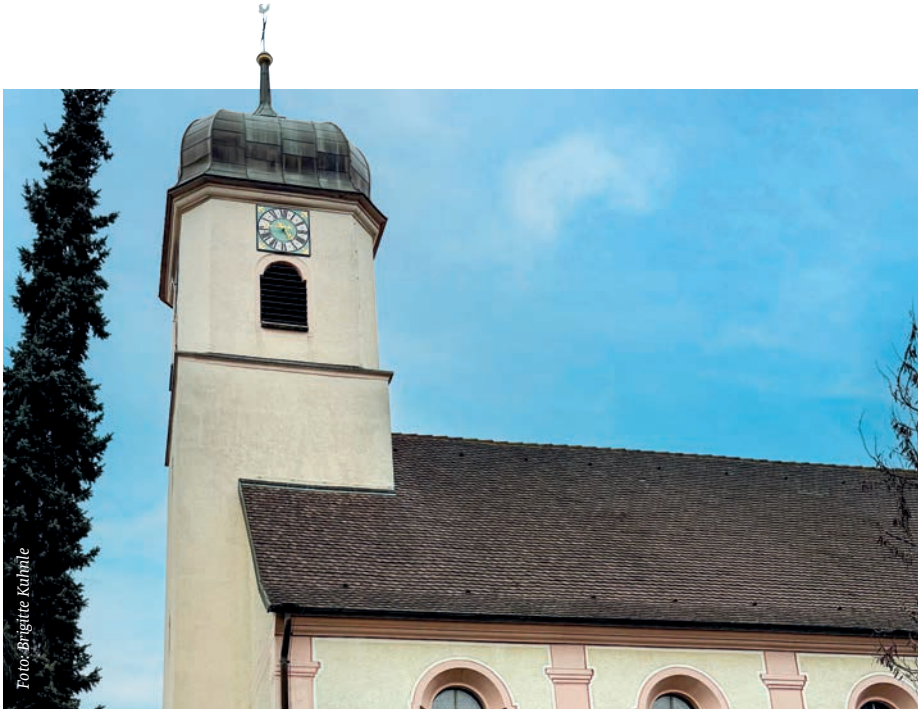
Kirche St. Gallus in Merzhausen